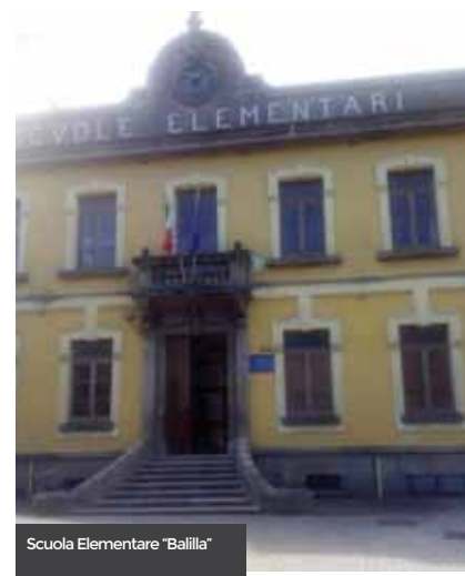
Scuola Elementare "Balilla"

sì, sottolineare la grande attenzione rivolta da questa amministrazione all'edilizia scolastica ed alla sicurezza degli edifici: la partecipazione progettuale al piano triennale regionale 2018/2020 per gli interventi di messa in sicurezza delle strutture scolastiche equella presentata al Ministero dell'Istruzione, dell'Università e della Ricerca per le scuole "Francesca De Carolis" e "Compagnone". La convinzione è che sia nostro dovere garantire alle future generazioni la qualità e la sicurezza degli ambienti formativi. E poi il rifacimento della facciata esterna della locale Stazione dei