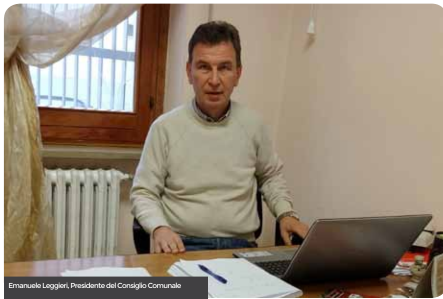
Emanuele Leggieri, Presidente del Consiglio Comunale

co in Lamis e Istituto Giannone per il progetto Città che Legge 2018-2019 - proposta di adesione all'Associazione "Cammino della Pace", al fine di diffondere l'interculturalità e la inter-religiosità e favorire il turismo.