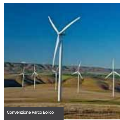
Convenzione Parco Eolico

Da qualche mese il Sindaco mi ha conferito, come consigliere comunale, la delega all'istruzione, che spero di svolgere con la stessa efficacia di quella precedente. Particolare attenzione sarà prestata alla programmazione annuale degli interventi per il diritto allo studio, all'offerta di servizi adeguati alla frequenza scolastica (trasporto, mensa, interventi complementari), alla sicurezza degli edifici scolastici ed al sostegno dei piani scolastici dell'offerta formativa.