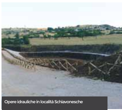
Opere idrauliche in località Schiavonesche

nutenzione della Strada Statale 272, che ha visto il rifacimento del manto stradale nel tratto da Stignano fino al confine territoriale con San Giovanni Rotondo. E, per finire, la costante partecipazione, il supporto ed il patrocinio del nostro Comune concesso ad eventi culturali, sociali, religiosi ed economici svoltisi nella nostra città e organizzati con la collaborazione delle associazioni operanti sul territorio, per un ritrovato senso di comunità di cui la nostra città aveva e ha bisogno. In particolare, ricordiamo l'evento di portata nazionale e, ormai, internazionale "Grani Futuri", in cui si celebra il pane, prodotto tipico del nostro territorio.