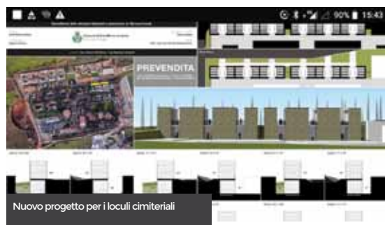
Nuovo progetto per i loculi cimiteriali

Villa comunale: Dopo meno di una settimana dall'insediamento, l'Amministrazione, rilevato lo stato di fatiscenza della Villa comunale e le proteste dei cittadini per la scarsa illuminazione presente che ne impediva una corretta fruizione, ha provveduto a potenziare e migliorare l'illuminazione, restituendo tale spazio alla città e facendolo tornare luogo di aggregazione per famiglie, giovani e anziani. Di recente, grazie ad un finanziamento regionale, è stato ripristinato l'impianto irriguo con rifacimento delle aiuole presenti e trattamento farmacologico dei platani.