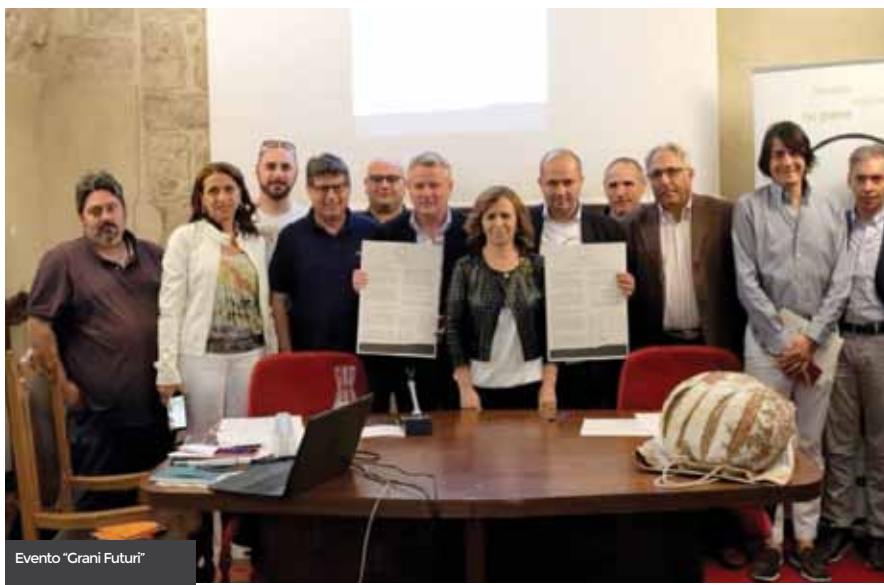
Evento "Grani Futuri"

Oltre ai temi che hanno impegnato gli assessori e i consiglieri nell'esercizio delle loro funzioni e che nelle pagine successive verranno espone in dettaglio, voglio sottolineare alcuni degli obiettivi raggiunti dall'amministrazione che ho l'onore di guidare. Mi riferisco innanzitutto ai finanziamenti ottenuti con fondi strutturali europei, come la bella scommessa vinta insieme ai comuni limitrofi sulla "rigenerazione urbana". Proget-