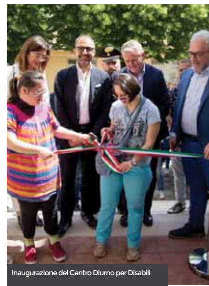
Inaugurazione del Centro Diurno per Disabili

di questo progetto, stante il riscontro positivo incontrato ed i risultati raggiunti nell'inserimento dei ragazzi diversamente abili. Sempre da due anni è attivo il servizio dei nonni vigili che, con la presenza costante degli agenti di polizia municipale, aiutano i bambini in entrata ed uscita da scuola ad attraversare la strada. Altri due progetti sono stati finanziati per il servizio civile che coinvolgerà prossimamente otto ragazzi in attività sociali, con impegno di rinnovare i progetti per la prossima annualità. Da ultimo, si segnala l'apertura, dall'ottobre del 2016 nel nostro comune, del punto di ascolto del Centro Antiviolenza sulle Donne, aperto il martedì di ogni settimana dalle ore 16 alle ore 19, con le operatrici del "Telefono Donna". Il fine è quello dell'ascolto e dell'accoglienza in favore delle donne, ricreando un luogo protetto di riflessione e di ricostruzione di sé e del proprio valore, sottraendo le stesse da situazioni di violenza e maltrattamenti. Ulteriore attività verrà svolta nei prossimi anni e verrà resa nota alla comunità cittadina con la presentazione della programmazione triennale del Piano Sociale di Zona.