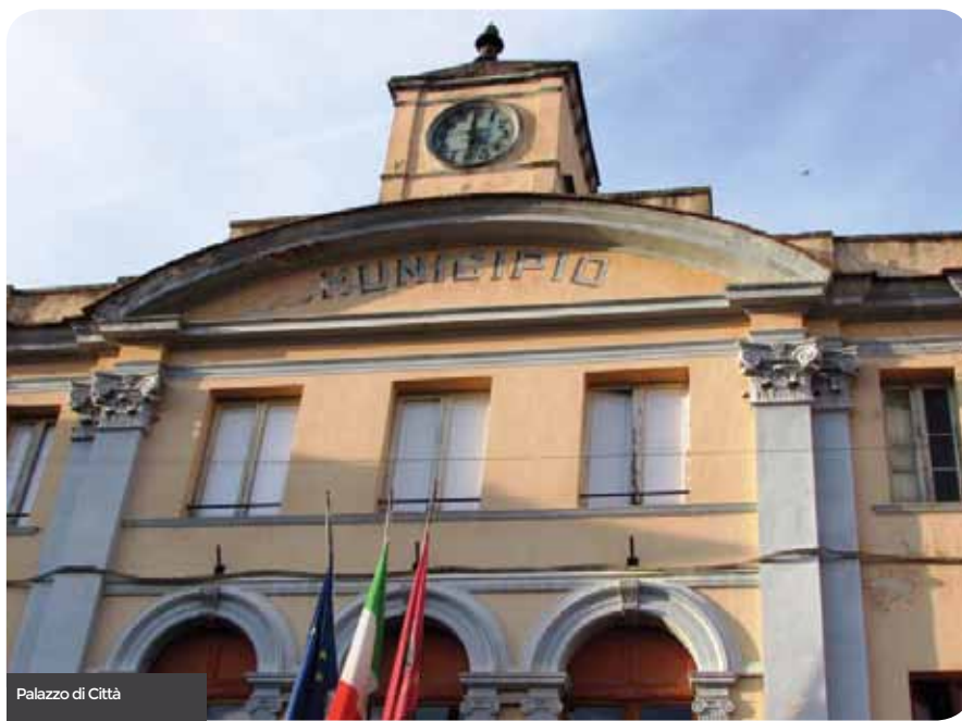
Palazzo di Città

Il riconoscimento, da parte del Ministero degli Interni, di finanziamento di oltre 5 milioni di euro per la ristrutturazione e messa in sicurezza dell'edificio scolastico "Balilla" e di Palazzo Badiale, simboli il primo del futuro e il secondo della storia della nostra città.