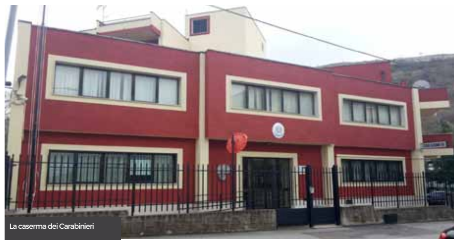
La caserma dei Carabinieri

attività e lavoro per la nostra comunità. Oltre questa funzione consultiva, la Commissione si è occupata anche di fare chiarezza su temi controversi come la discussione e l'approfondimento dell'art. 10 Legge Regionale N. 21 del 2011 in materia di Urbanistica e in più sedute comuni, svolte unitamente alla Commissione Bilancio, si è anche argomentato sulla vexata questio riguardante la transazione con la ReEnergy, poi conclusasi con esito positivo. Questa Commissione Consiliare ha svolto, e continuerà a farlo per tutta la durata del suo mandato, una funzione di ascolto, di studio e di approfondimento di tutte le più importanti tematiche che riguardano il nostro Ente, sempre con spirito di collaborazione e coinvolgimento soprattutto delle minoranze presenti in Consiglio, onde addivenire ad una soluzione concordata ed unanime delle problematiche della nostra città.