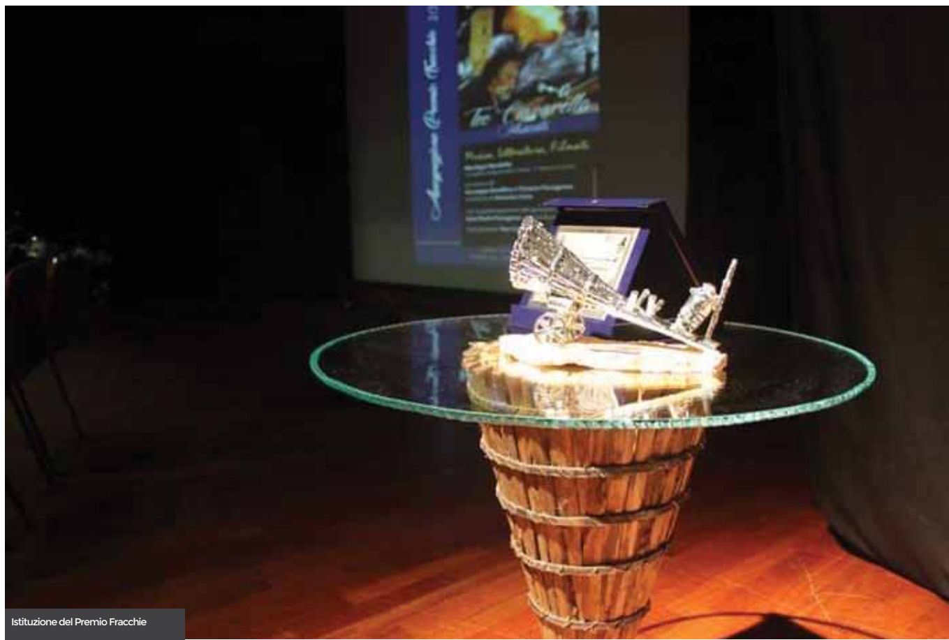
Istituzione del Premio Fracchie

2017 e Fausto Leali nel 2018 e tutti gli eventi culturali, organizzati dall'Amministrazione comunale e dalle associazioni presenti nel territorio. Ed ancora la partecipazione attiva alle giornate di visite guidate del progetto 99 BORGHI, tenutesi ad aprile e ad ottobre 2017 al Convento di San Matteo e al Parco dei Dinosauri. Di alta valenza culturale è stato il riconoscimento di CITTA' CHE LEGGE 2018-2019 da parte del Ministero dei beni e delle attività culturali, ottenuto dal nostro Comune grazie alla qualità della attività culturali svolte dall'Istituto Secondario Superiore Giannone attraverso i progetti "Incontro con l'Autore" e "Leggo QuINDI Sono" . Infine, concesso il patrocinio al progetto per le scuole "Daunia sulle vie della storia-Itinerari di Cultura e del Gusto della Daunia" , che