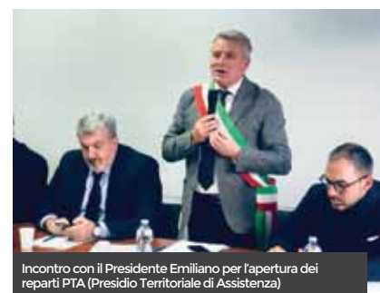
Incontro con il Presidente Emiliano per l'apertura dei reparti PTA (Presidio Territoriale di Assistenza)

zi Cimiteriali; la gara per la raccolta dei rifiuti solidi urbani; la gara per la cessione delle aree per le attività produttive di Coppe Casarinelli e il completamento dell'iter procedurale per le aree del PIP "Le Vetrine del Gargano" di Borgo Celano; la programmazione della tappa del Giro d'Italia insieme ai Comuni di San Giovanni Rotondo e Rignano Garganico; il miglioramento della viabilità cittadina con il rifacimento delle due Rotonde di Viale Europa (in fase di elaborazione progettuale); la prosecuzione degli interventi di rifacimento del manto delle strade cittadine e di quelle di Borgo Celano; la messa in sicurezza e riqualificazione del Centro Sociale Polivalente per Anziani; i lavori per la mitigazione del rischio idrogeologico e la messa in sicurezza del territorio da effettuarsi con i finanziamenti ottenuti sia direttamente dal Comune di San Marco in Lamis, sia programmati con il supporto del Commissario Straordinario delegato al Dissesto Idrogeologico della Regione Puglia. Si tratta di cinque interventi già programmati per un ammontare complessivo di circa 6 milioni di euro. Questo e tanto altro ancora arriverà grazie alla partecipazione ad ulteriori bandi europei e ministeriali, che avremo cura di comunicare in futuro alla città. A voi cittadini ancora un ringraziamento per la fiducia accordata ed a tutti noi un buon lavoro!