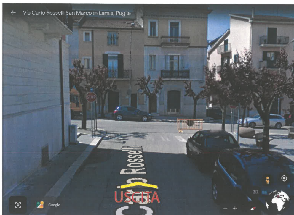
Fig. 3: uscita area.

Gli orari di apertura resteranno invariati visto che tale circostanze non prevedono un rischio per gli avventori.